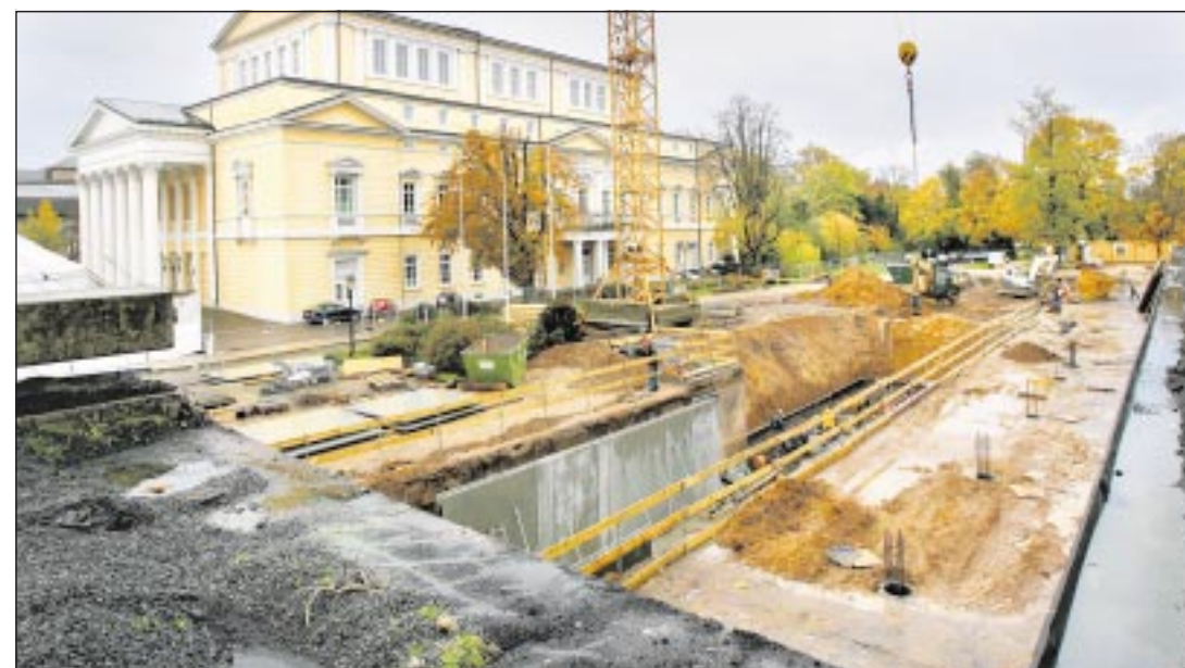
Baustelle am Staatsarchiv: Für das neue Kongresshotel am Karolinenplatz sind bereits tiefe Schächte in die Erde getrieben worden. Die Eröffnung soll zeitgleich oder wenige Wochen vor der Eröffnung des Kongresszentrums am 6. Dezember 2007 sein.

„Die Technische Universität hat am Karolinenplatz ihre Chance ergriffen, aktiv ihr Umfeld mitzugestalten“, sagt TU-Kanzler Seidler. Der Platz werde Bindeglied zwischen dem TU-Campus Stadtmitte und der Innenstadt. Das neue Eingangsgebäude biete mit dem neuen Informationszentrum für Studenten eine zentrale Anlaufstelle. Seidler weiter: „Unser gemeinsames Ziel ist es, eine ganz neue Situation zu schaffen.“ Diese Zukunft ist nah – und nicht einmal 400 Tage entfernt. uni