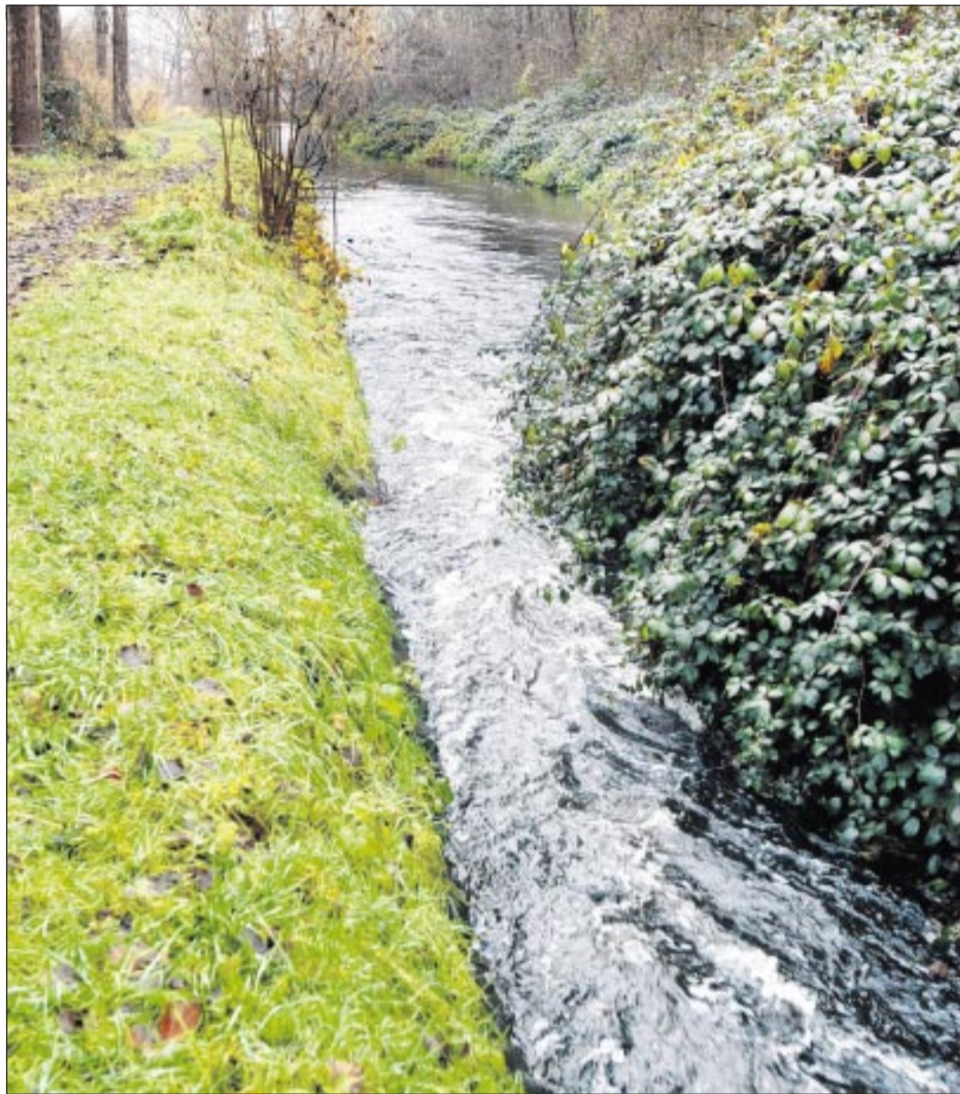
Adieu, Darmbach: Um eine Hecke herum fließt er bei Griesheim in den Landgraben.