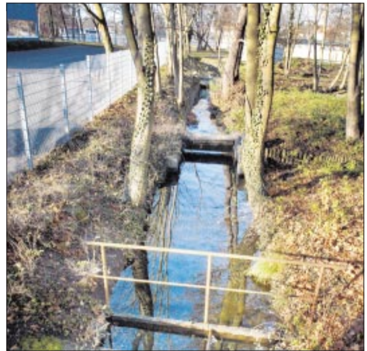
Gerade zum Woog: Darmbach am Trainingsbad.